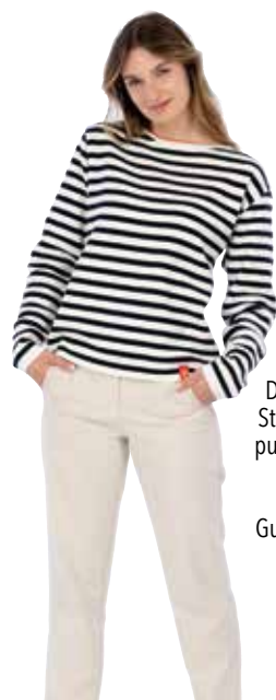
Rundherum gute Laune Das schreit förmlich Sommer, Sonne, Strand und gute Laune. Der Langarm-pullover von SURI FREY lässt sich ganz wunderbar kombinieren. Ob Jeans, Rock oder Chino, dieses Shirt ist ein Gute-Laune-Statement par excellence. www.surifrey.com