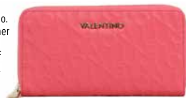
Alles im Blick Portemonnaie „Relax“ von Valentino by Mario Valentino. Es kostet 59,99 Euro und ist aus Kunstleder. Der Italiener Mario Valentino gründete sein Unternehmen schon in den 1950er Jahren und sicherte sich schnell einen Ruf als einer der wichtigsten Accessoire-Designer der Welt. www.zalando.de