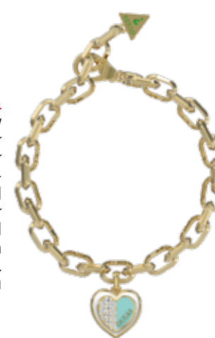
Es wird romantisch Gliederarmband von GUESS Jewellery aus der Kollektion „Lovely Guess“. Der türkisfarbene Emaillie-Herz-Anhänger mit funkelnden Kristallen scheint sich flügelartig von seinem weißen Hintergrund abzuheben und ist somit ein absoluter Blickfang. Aus Edelstahl, Emaillie und hochwertigen Kristallen und ebenfalls in Rosa für UVP: 69,- Euro erhältlich. www.guess.eu