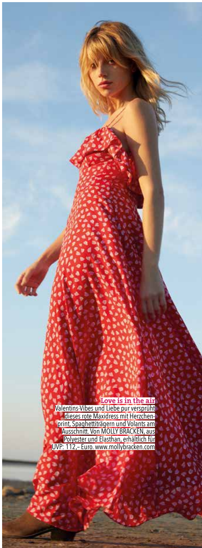
Love is in the air Valentins-Vibes und Liebe pur versprüht dieses rote Maxidress mit Herzchenprint, Spaghettiträgern und Volants am Ausschnitt. Von MOLLY BRACKEN, aus Polyester und Elasthan, erhältlich für UVP: 112,- Euro. www.mollybracken.com