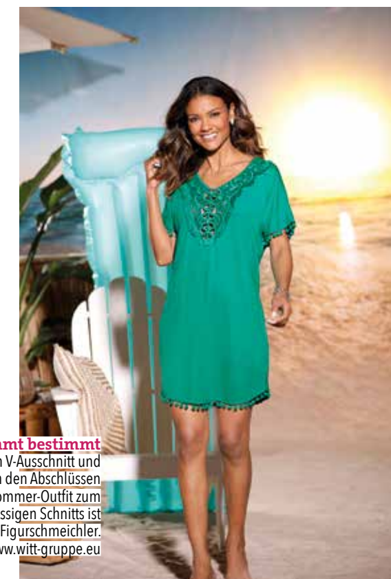
Der Sommer kommt bestimmt Hübsche Spitze am V-Ausschnitt und witzige Bommeln an den Abschlüssen machen dieses Sommer-Outfit zum Hingucker. Dank des lässigen Schnitts ist die Tunika ein echter Figurschmeichler. UVP: ab 39,99 Euro. www.witt-gruppe.eu