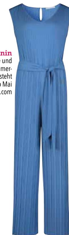
Feminin Dieser Jumpsuit mit Plissee und Taillengürtel ist ein absolutes Sommer-Must-have. Er kostet 129,99€ und besteht aus 95% Polyäthylen, 5% Elasthan. Ab Mai erhältlich. www.bettybarclay.com