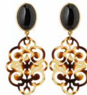
Bist Du ganz Ohr? Die kunstvoll handgefertigten Ohrhinge der Münchener Schmuckmanufaktur JustWin vereinen Eleganz und All-tagstauglichkeit zugleich. Mit diesen Ohrhingen komplettest du unzählige Outfits. www.justwinmuc.de