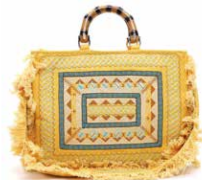
Hola guapa Inspiriert von diesem ganz besonderen Ibiza-Feeling, hat SURI FREY für eine Tasche designt, die uns jeden Tag mit der nötigen Portion Sommer, Sonne und guter Laune versorgt. Der geräumige Shopper bietet ausreichend Platz für alles, was man am Strand so braucht. Jede SURI FREY Tasche ist vegan. www.surifrey.com