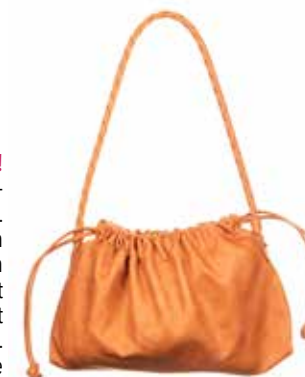
Klein aber oho! In auffälligem Orange zieht die Echtle-dertasche von Vanzetti alle Blick auf sich. Trotz ihrer handlichen Größe ist sie ein echter Hingucker und kann auch noch vieles mehr. Dank des Zugbandes lässt sich die Tasche weit öffnen und erlaubt problemlos den Zugriff auf den Inhalt. www.zalando.de