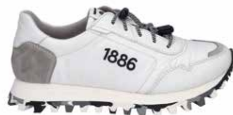
Ganz bequem Josef Seibel 1886 Sneaker aus der „Spirit of Nature“ Linie, UVP: 240 Euro, wird aus nachhaltigen und recycelten Materialien von Hand in Hauenstein (Deutschland) gefertigt. Kann nach eigenen Wünschen konfiguriert werden. Ein wahrer Kult-Sneaker. www.josef-seibel.de